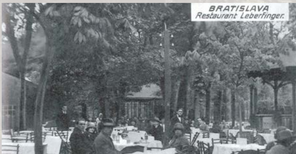
Historická fotografia – terasa Leberfingeru.