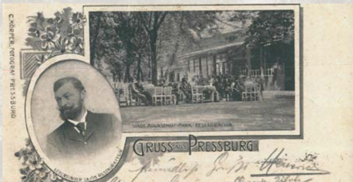
Historická pohľadnica – terasa Leberfingeru